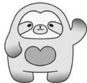
なごもっかマスコット キャラクター なごもん