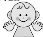
なごや子どもの権利条例 マスコットキャラクター なごっち