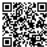
なごや子どもの権利条例

どの子ども生まれたときから一人一人が大切にされる権利をもっています。どんなに小さな時も、自分の気持ちがあり、それが大切にされることで、安心して自信を持って成長していくことができます。子どもだからこそ大切にされる「子どもの権利」があるのです。名古屋市には、みなさんの大切な権利についての約束「なごや子どもの権利条例」があります。