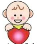
なごやし子どもの権利条例 マスコットキャラクター なごっち