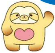
なごもっかマスコットキャラクター なごもん