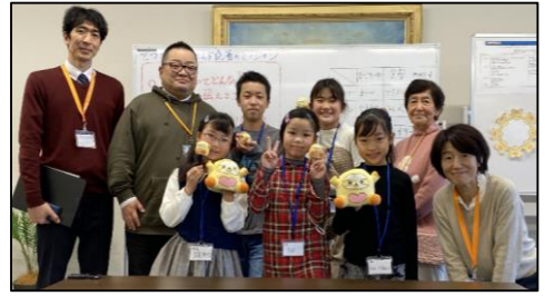
どうじつ インタビューにさんかしてくれたみなさん

かわくちいいん 【川口委員からひとこと】 きょうりくがく けんきゅう がくしゅうしえん けいけん い 教育学の研究や学習支援の経験を活かしながら、 こ こま よ そ こ 子どもたちの困りごとに寄り添って、子どもの権利を まも 守っていきますので、これからよろしく願います。