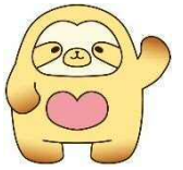
なごもっか マスコットキャラクター なごもん